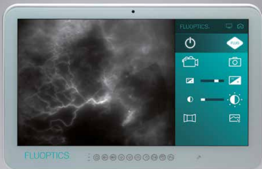
Petits vaisseaux lymphatiques

Identification de vaisseaux lymphatiques fonctionnels